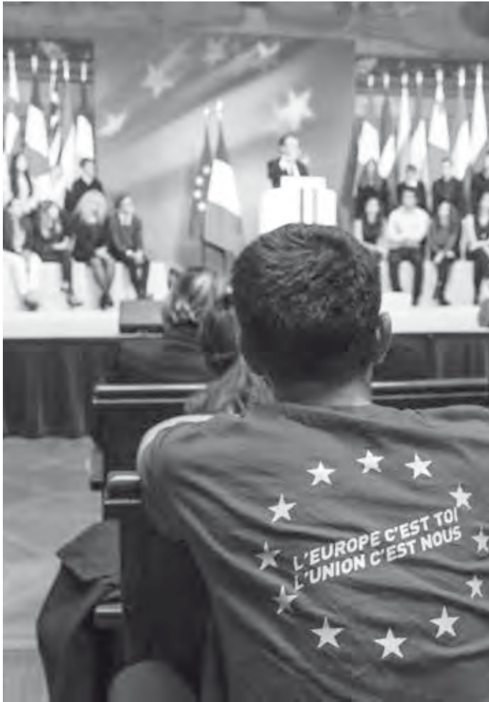
»Du bist Europa, wir sind die Einheit« – Macron-Rede in der Pariser Sorbonne, 26.9.2017

Über- oder Unterschreiten von Schwellenwerten verhindert werden könnte. Zwar hat die Kommission als Ergänzung zur ESSR eine Reihe von sozioökonomischen Indikatoren veröffentlicht, die dazu dienen sollen, die Fortschritte bei der Realisierung der sozialen Rechte zu überprüfen, bleibt aber auch dabei unverbindlich. 16 Einen alternativen Weg hatte 2013 der damalige Sozialkommissar Laszlo Andor gewählt. Er legte Indikatoren und Instrumente zur Vertiefung der sozialen Dimension der Integration fest. 17 Dieser bislang progressivste Vorschlag, der aus Kreisen der Kommission zu diesem Thema je die Öffentlichkeit erreicht hat, wurde von den europäischen Sozialministern jedoch zu einem unverbindlichen Katalog von Indikatoren kleingeredet, die im Rahmen der wirtschaftlichen Koordination während des alljährlichen Europäischen Semesters Berücksichtigung finden sollten. 18