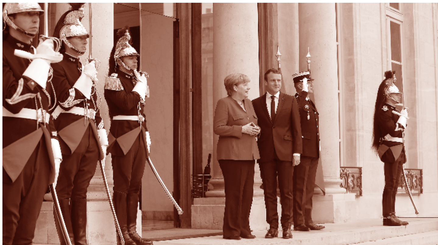
Angela Merkel und Emmanuel Macron, Kabinettsstreffen in Paris, 12.7.2017